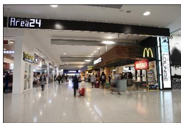
24 時間営業の店舗が集まる『Area24』