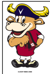
ヴィッセル神戸 「モーヴィ」