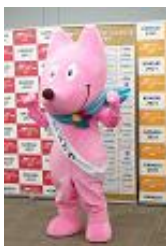
関西ワールドマスターズ ゲームズ2021「スフラ」

関西ワールドマスターズゲームズ2021の大会マスコット「スフラ」や、関西のJリーグマスコットが、国際線到着口で外国人観光客を出迎える。(Jリーグマスコットはいずれかの日に登場)