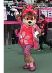
セレッソ大阪 「マダム・ロビーナ」