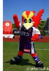
京都サンガF.C. 「バーサクん」