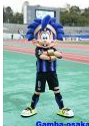
ガンバ大阪 「GAMBA BOY」