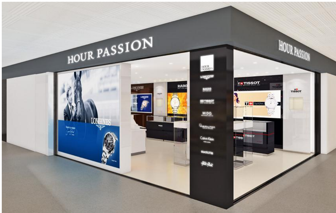
【店舗イメージパース(正面)】