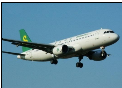
春秋航空 エアバス A320 型機