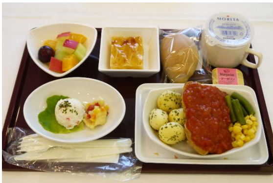
ハラール機内食メニュー(チキン)

(以下のメニューは一例であり予告なしに変更する場合がございますので、お申し込みの際にご確認 下さいますようお願いいたします)