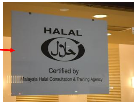
(第1ターミナル2階「ざ・U-don」のハラール認証)