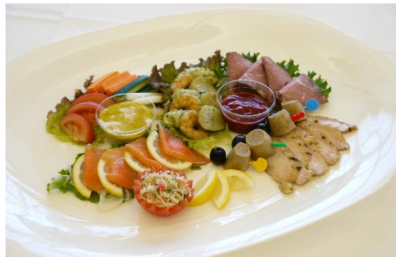
ハラールオードブル 盛り合わせ