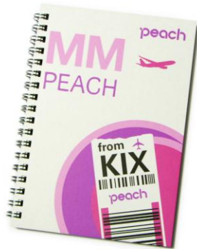
Peach × KIX コラボノート 8 月 9 日発売