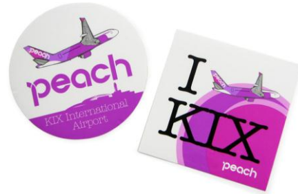
Peach × KIX コラボステッカー 6 月 14 日発売