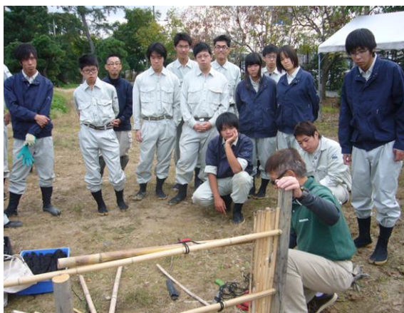
環境緑化科 実習風景