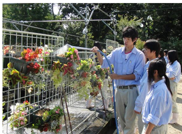
フラワーファクトリ科 実習風景